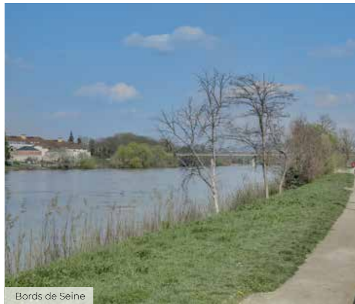
Bords de Seine